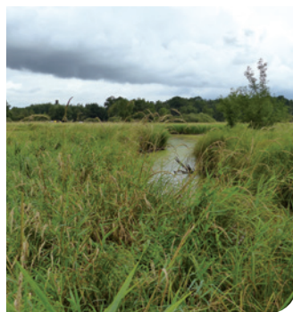
Berges de l'étang