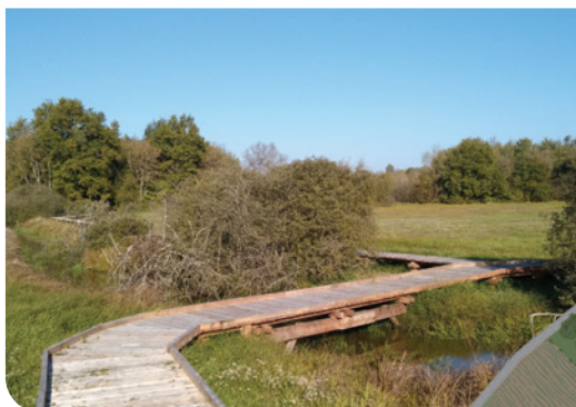
Pilotis sur la vieille Sâne

Chacun peut trouver ici un parcours à sa portée :